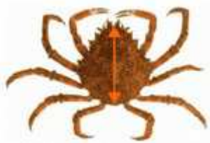
Araignée de mer